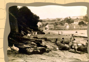
1. Playa de la Fuente