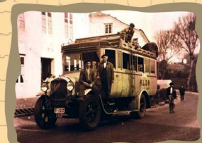
2. Parada del Alsa