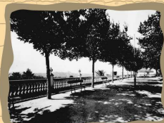
10. Paseo del Espolón