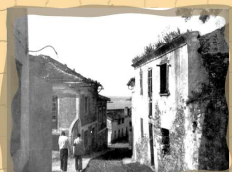
13. Calle del Muelle