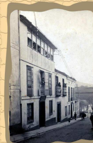
3. Hotel Guerra