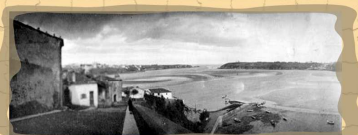
16. La Ría desde la Mirandilla