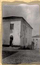
15. Biblioteca Popular Circulante