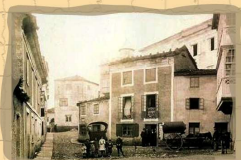
17. Plaza Menéndez Pelayo