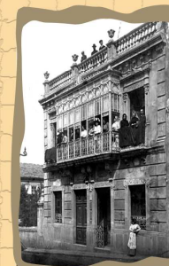
7. Casa de Canel