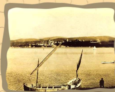
11. Santiniebla desde Peñapal