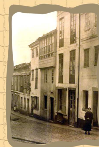
4. Plaza del Cruzadero