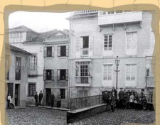
14. Plaza del Ayuntamiento