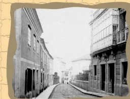
6. Calle del Campo