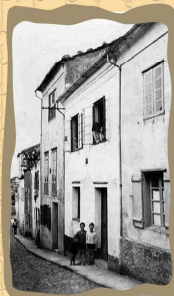
12. Calle del Pozo