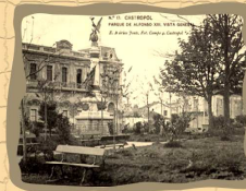
9. Parque y Casino