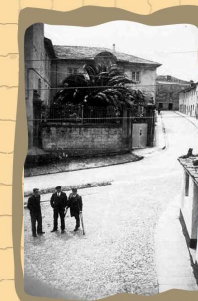
5. Villa Rosita