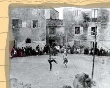
8. Titiriteros en Castropol