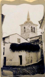
18. Torre de la Iglesia